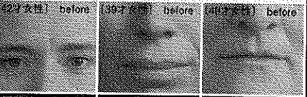
※治療前後の症例写真はHPでご紹介

注射器1本 105,000円 ※シワの状態により注入本数は異なります。 Immediate & long-lasting 効果がすぐに現れ、長期間(5年以上)持続します。 Low cost 効果や満足度に対し経済的です。 No allergic アレルギー反応を起こしません。 Non-resorbable 非吸収性です。 ◆注射器で施術できる注入治療では「眉間や額、目尻、ほうれい線」など顔のシワをふっくらさせ改善することができます。表情に関係なく、できてしまった「固定化されたシワ」に大変効果的で、メスを使うことなく切らずにできる簡単な施術です。 ◆注入剤は、97.5%の純水と2.5%のポリアクリルアミド(ソフトコンタクトレンズの原料)で構成されたまったく無害の物質で、仕上がり極めてナチュラルになります。 ◆注入後は、皮膚組織内に薄い膜を張り周辺の組織と融合してボリュームを与え、凹んだ肌をふっくらとさせます。