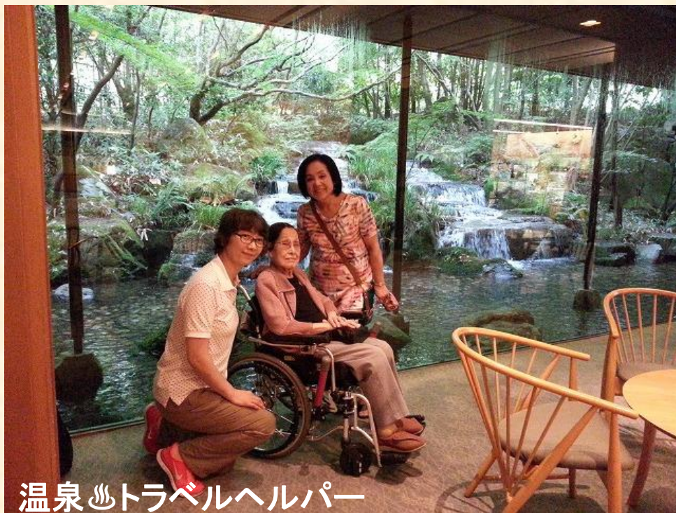
温泉 〰️ トラベルヘルパー

「あー楽しかった。また行きたいわ。今度はどこへ行こうかしらね」と、次のご旅行の期待が大きく膨らんでいっちゃいました。7年ぶりのお出かけに、すべてのものに目を輝かせて愉しまれていました。