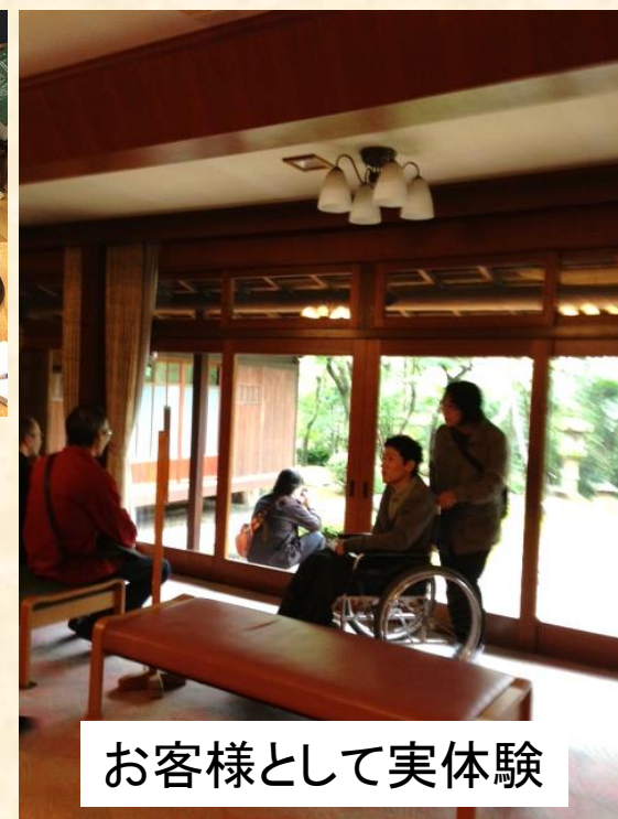
お客様として実体験

講義&ワークショップ ○障害者差別解消法への対応 ○おもてなしについて ○館内のバリアフリーの検証と提案の共有 ○研修のフィードバック ○理念共有等