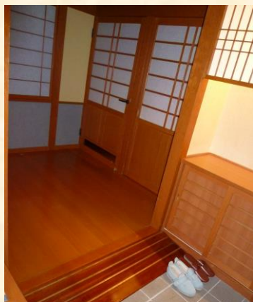
館内 バリアフリーチェック