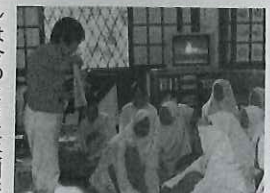
コタキナバルの学校で在者もあまりいなかった。そこで私塾を開きました。ただ、最近日本語を習う環境や情報も豊富になってきているのか、教える技術や能力のレベルアップを求められきています」

「肇慶衛生学院」などでは年金受給者で現地の報酬に依存しないシニア向きだ。さらにR&Iが推進する「りらいぶ」による、新たな人生を長期滞在しながら社会貢献したいという方には好機となる。この他、肇慶市では「肇慶華洋外国语学校」