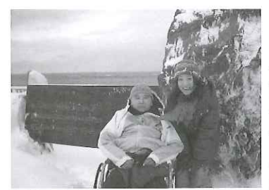
↑吹雪で飛行機が欠航したにもかかわらず、お客様の熱望とトラベルヘルパーの親身な対応で無事帰国へ

「外出したいけれど1人では不安」「付き添いを頼める人がいない」と、外出・旅行をあきらめてしまう高齢者は多い。また、人手が足りず外出イベントに踏み切れない介護事業者もいるだろう。株式会社SPI あ・える倶楽部では、外出時の介助に精通したトラベルヘルパーの派遣で、戸外での快適な時間を提供する。