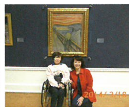
▲右・岡安トラベルヘルパー

あなたにとっての「行きたい場所」をトラベルヘルパーと一緒に「行ける場所」にしてみませんか？