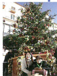
▲左・坂本トラベルヘルパー

いつもわくわくさせていたきてます。これからは温泉旅行だけでなく、ディズニーリゾートも定期的に訪れたいとおっしゃっていました。