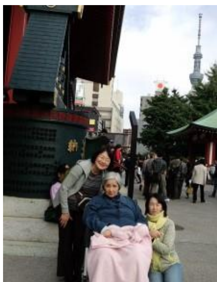
坂本トラベルヘルパー（左）とお嬢様に挟まれてパチリ