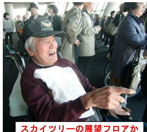
スカイツリーの展望フロアからの眺めに感動です！

ご長男様が自らU様に「どう？見える？高いねえ」「あれが浅草寺だよ」と適宜楽しませようお声掛けされ、U様も嬉しそうな表情が多く見られました。浅草ではお二人の思い出の地という事で、ご長男様が幼少の頃にU様に映画を観に連れてきてもらい、オムライスを食べたのを覚えているとの思い出話をされ、実際にその場所に行ってみると、映画館はパチンコ屋になっていてその隣にオムライスのお店があり、営業していませんでしたが店構えは当時のままで、お二人で記念撮影、寂しさの中にも懐かしむご様子が見えました。そのご様子を見ながら、お二人の現在まで色々な事があつたであろう数十年の思い出、ご長男様がお父様を想うお気持ちを想像し、温かい気持ちになりました。また同時にこの様な旅に同行しお力添え出来た事のすばらしさに感謝の気持ちでいっぱいになりました。