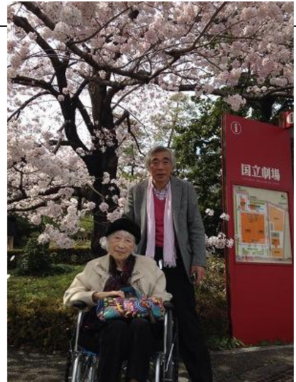
あ・える倶楽部ニュース

ご自身も日舞の経験がおりないので、三味線の音に合わせ、自然に手が動きだしてました。「まるで夢の世界にいるようだわ！(感動して)涙が出ちゃった！」とおっしゃった時のチャージングな笑顔が印象的でした。満開の桜の下での甥ご様との2ショット写真もバッチリ！好奇心旺盛な1様、これからもお元気で大好きなお出かけを楽しまれる事でしょう。とても楽しい時間を一緒に過ごさせていただきありがとうございます。