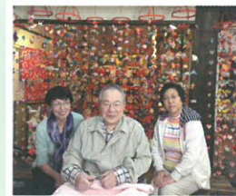
籠のつるし飾り前で

「温泉に入って家族でゆっくりしたい」「感染予防しながら気兼ねなく自分のペースで観光したい」という方、東伊豆にお出かけしてみたいはいかがでしょうか。トラベルヘルパーが笑顔でお待ちしています。