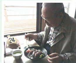
漁港で海の幸の丼に舌鼓を打つ