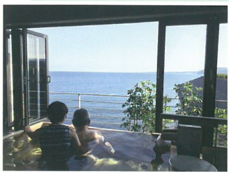
きらきらと輝く相模湾を見ながら温泉を楽しむ

百年に一度と言われているパンデミックのトンネルの出口がまだ見えない状況ですが、ハッピーエンドに、きっと近づいているはずだと思いたいです。今は、会いたい人にも会えませんが、「会えないあの人」「遠くに暮らすあの人」のことを考える時間は、自然と心をやさしくしてくれます。みんなで励まし合いながら、上を向いて歩こうと口ずさみながら、空を見上げて、もうひと踏ん張りしていきましょう。