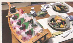
温泉の後は、豊かな海の幸を自分のペースでゆっくりといただく。