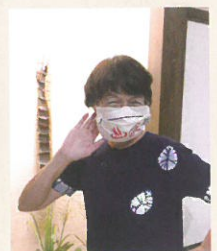
トラベルヘルパーのマスクに◎マークを入れて、気分を盛り上げます。

介護保険サービスの対象とならない心配事などがありましたら、何なりとお気軽にご相談ください。あ・える倶楽部は、高齢の方、介護するご家族の味方であり続けられるよう努めてまいります。