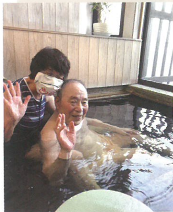
「やっぱり温泉はほっとするなあ。身体が芯から温まるなあ」

コロナ禍で、遠方への旅行を控えているお父様をリフレッシュさせてあげたいと、自家用車を使って、ほんの少し遠出して、温泉に入り、おいしいお料理を食べ、ゆったりとした父娘の時間をもちました。このご家族の小旅行に、私たちトラベルヘルパーがお手伝いさせていただきました。