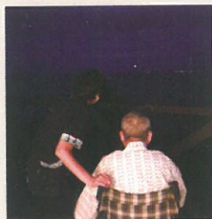
夜、海の方角に美しく輝く満月をながめる。

父娘でゆったりと気兼ねなく静かに過ごして、コロナ禍でたまったストレスを解消し、心身のリフレッシュを愉しんでいただきました。