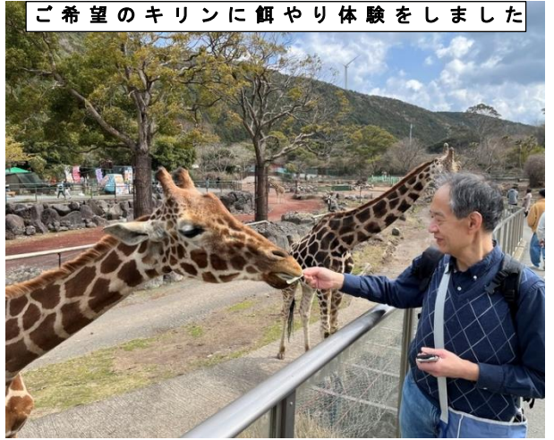
ご希望のキリンに餌やり体験をしました