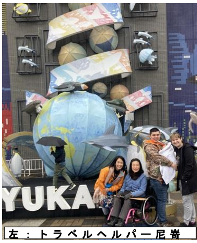
左：トラベルヘルパー尼崎

お姉さまとゆったり過ごして、日本は、母校の小学校を訪問されたり、爆資料館を見学され、トラベルヘルパーとはお別れし、ふるさと高松では、母校の小学校を訪問されたり、お姉さまとゆったり過ごして、日本滞在を満喫されました。