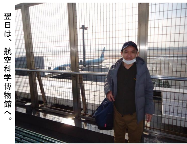
翌日は、航空科学博物館へ。

【編集後記】 今月の「にこにこ新聞」も、「トランベルヘルパーマガジン」の最新の記事から選んでご紹介しました。 旅先での出来事や感動が一つの物語として紡がれる様子や、お客様の素敵な体験談を読むと、心が温かな思いに包まれます。春の優しい陽光の下で、皆様にとっても心豊かな旅の思い出を作ることができることを願っています。 そして、次号も皆様に笑顔と感動をお届けできるよう、努めてまいります。次号もお楽しみに！