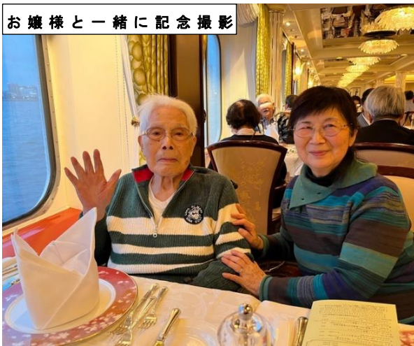
お嬢様と一緒に記念撮影

カジノでは、馴染みのスタッフに遭えてご満悦に加え、剛運を振るいチップが大量に増えて満足そうでした。