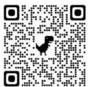
トランベルヘルパーマガジン