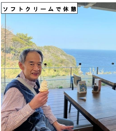
ソフトクリームで休憩

夕食は、もちろん金目鯛です！金目鯛の漁師煮がとても美味しい！という笑顔をいただきました。