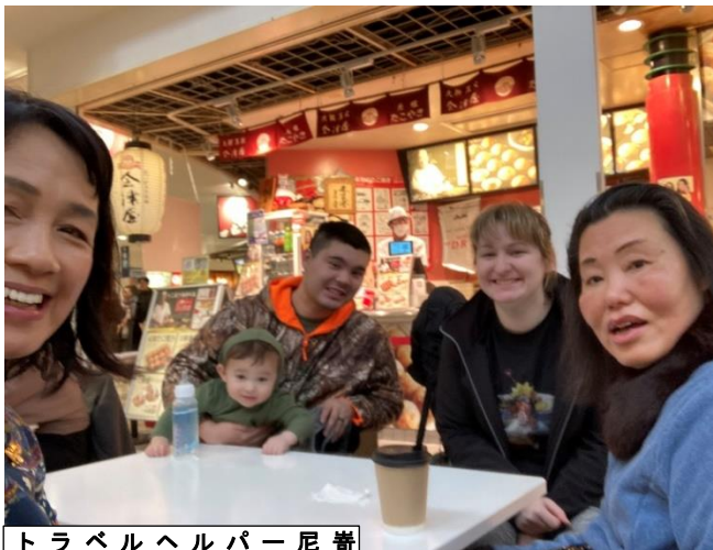
トランベルヘルパー尼養

成田空港、航空科学博物館、成田山新勝寺、千葉ポートタワー、グルメ、千葉県を満喫した二泊三日の旅