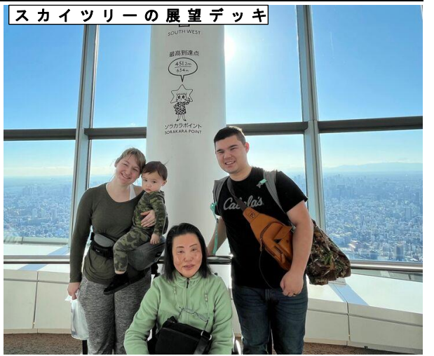
スカイツリーの展望デッキ

東京観光は、しっかり予定を決めずにトラベルヘルパーと都度相談しながらスカイツリー、秋葉原などを回り、ご夕食は、回転寿司を楽しまれました。